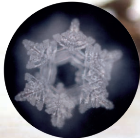
EM-X Gold cristal